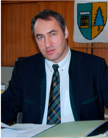
Schmidl-Haberleitner betonte, sich an Beschlüsse halten zu müssen.